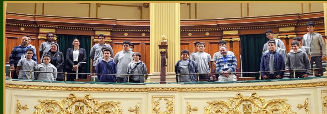
مجموعة من طلاب الصف الإعدادى بمدرسة القديس يوحنا دى لاسال - الفرير - باب اللوق ( 6 ديسمبر 2022 )