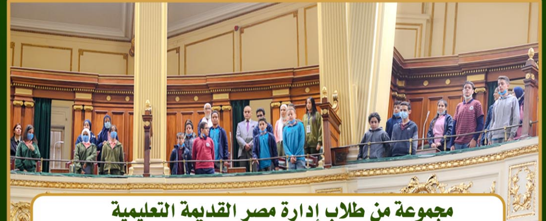
مجموعة من طلاب إدارة مصر القديمة التعليمية ( 4 ديسمبر 2022 )