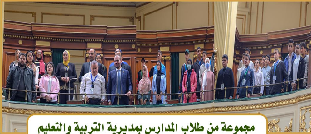
مجموعة من طلاب المدارس بمديرية التربية والتعليم بمحافظة المنوفية : مدرسة الشهداء الثانوية العسكرية بنين - ومدرسة الشهداء الثانوية بنات - مدرسة السادات الثانوية بتلا - ومدرسة تلا الثانوية بنات ( 5 ديسمبر 2022 )