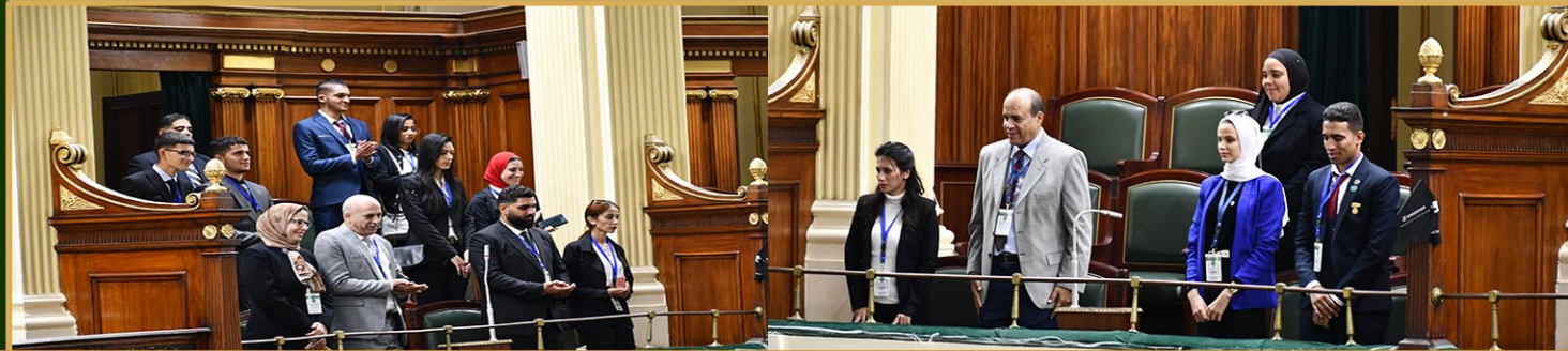
طلاب المعهد العالي للهندسة والتكنولوجيا بالعبور، ومعهد العبور العالي للإدارة والحاسبات ونظم المعلومات ( 22 نوفمبر 2022 )