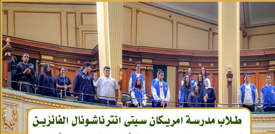
طلاب مدرسة امريكان سيتى انترناشونال الفائزين فى انتخابات اتحادات الطلبة ( 21 نوفمبر 2022 )