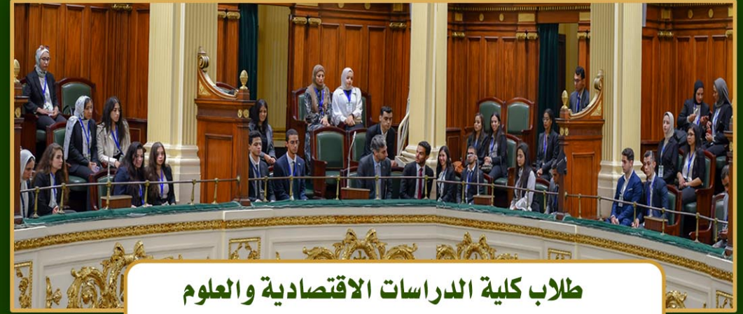
طلاب كلية الدراسات الاقتصادية والعلوم السياسية - جامعة الاسكندرية ( 20 نوفمبر 2022 )