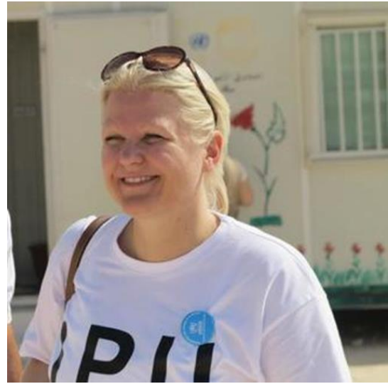
السيدة أولريكا كارلسون السويد مستشارة خاصة