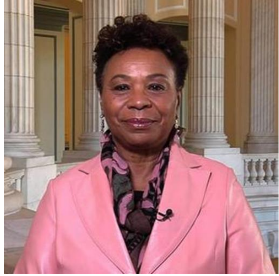
السيدة ب. بي الولايات المتحدة الأمريكية مستشارة خاصة