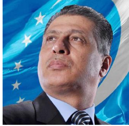
سعادة السيد أرشد الصالحي