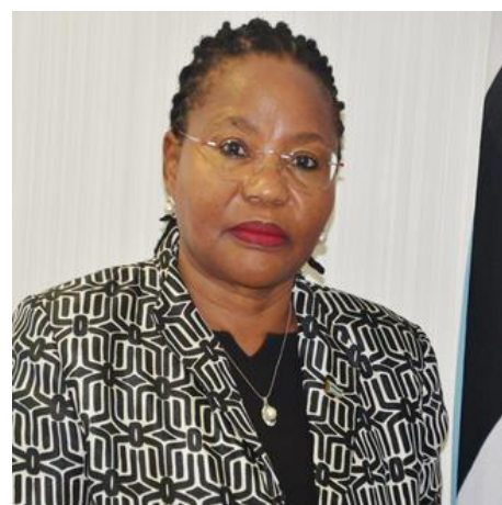
السيدة ن. و. ت. ماكوينجا