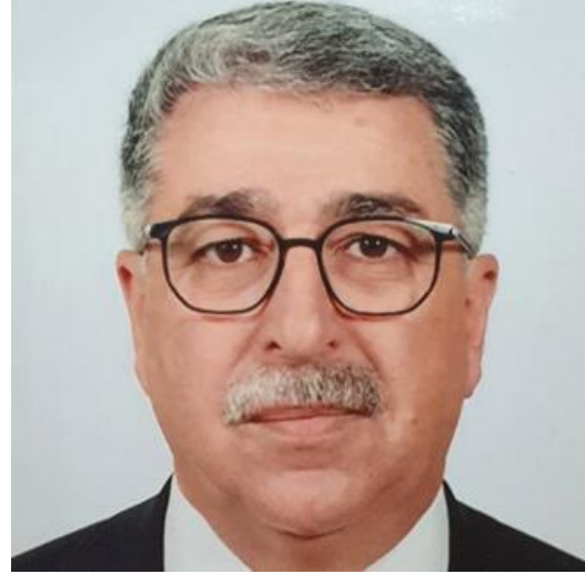
سعادة السيد موسى حديد