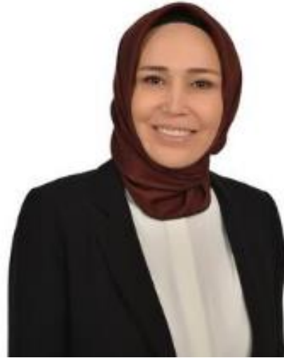
السيدة أ. أردوغان

انتهاء فترة الولاية: تشرين الأول/أكتوبر 2026