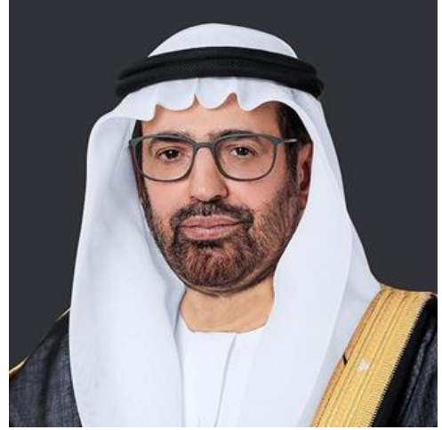
معالي الدكتور علي راشد النعيمي