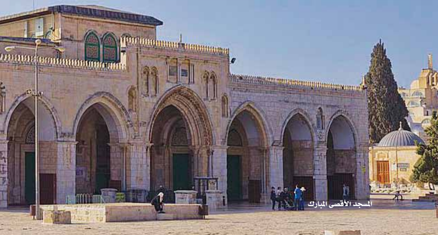
المسجد الأقصى المبارك

والزوايا وحدها حوالي ٣٤٨ (٦)، مما يدل على هوية هذه الأرض الإسلامية، لذا عمد اليهود إلى تدمير كل مظهر إسلامي فيها، فقد هدموا ١٢١٥ مسجداً في العام ١٩٤٨م (٧)، وهي سياسة إسرائيلية متفق عليها بين جميع الحكومات الإسرائيلية المتعاقبة، والجدول الآتي يبين مدى توغل اليهود في تغيير معالم الأوقاف في القدس (٨).