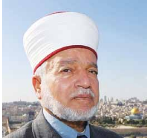
بقلم: الشيخ محمد حسين المفتي العام للقدس والديار الفلسطينية خطيب المسجد الأقصى المبارك

لنهبها (٣)، وعلى هذا النهج سلك اليهود طريقهم لمصادرة أراضي الوقف، وقد حرصوا كذلك على التكتم على أملاك الغائبين، وعدم السماح للجان الدولية بتقصي الحقائق حول أملاكهم، وقد تم استصدار قانون أملاك الغائبين عام ١٩٥٠م، وكان محاولة لإضفاء الصفة القانونية على سيطرة إسرائيل على الأراضي الفلسطينية، حيث يمنح القانون الوصي الإسرائيلي على أملاك الغائب الحق في الاستيلاء عليها وإدارتها، وإن تطبيق هذا القانون قد أدى إلى سيطرة إسرائيل على القسم الأكبر من أرض فلسطين، نظراً لأن معظم أصحاب هذه الأراضي قد هجروا منها قسراً بعد نكبة فلسطين عام ١٩٤٨م (٤)، ثم جاء قرار التقسيم عام ١٩٤٧، الذي أعطى اليهود ما نسبته ٦٠٪ مجحفاً في حق أصحاب الأرض؛ رغم أن عددهم كان أقل من ٥٠٪، وبشكل هذا تعدياً صارخاً من قبل عصبة الأمم على أصحاب الأرض الأصليين.