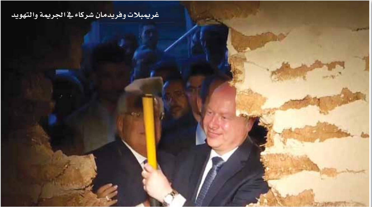
غريمبلات وفريدمان شركاء في الجريمة والتهويد

وطالب الحكومات العربية والإسلامية وبرلماناتها بالوقوف عند مسؤولياتها القومية والدينية وترجمة الأقوال إلى أفعال تنقذ القدس ومقدساتها الإسلامية والمسيحية من خطر التهويد والضياع، ودعاها لمشاهدة تباهي المستوطن