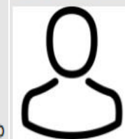
Further speakers to be announced